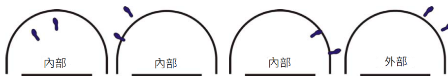
圖 5: 球員的位置：進攻免責區內部/外部

33-4 範例：A1 從進攻免責區外開始跳投。A1 撞上正與進攻免責區接觸的 B1。