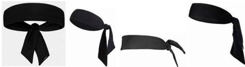
圖 1 頭巾式頭帶範例