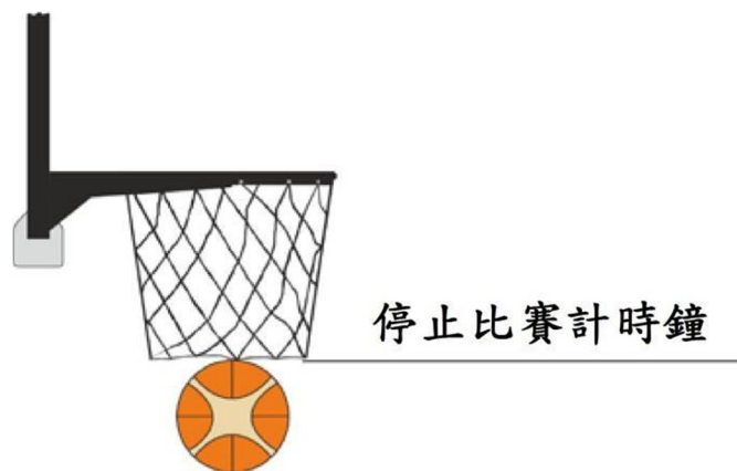
圖 2 球中籃

(b) 第 4 節或延長賽當比賽計時鐘顯示 2:00 或更少時，當整個球體穿過球籃時（如圖 1 所示），比賽計時鐘應停止。