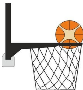
圖 4 球在球籃中

31-25 判例： A1 試投 2 分球，當球在籃圈上滾動且球的最小一部分在球籃中時，B1 觸及球。