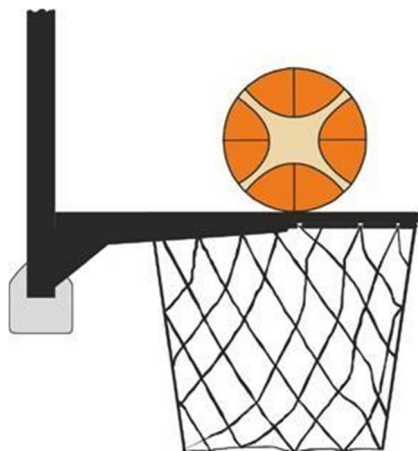
圖 3 球與籃圈保持接觸

31-19 說明： 投籃時，當球正與籃圈保持接觸且仍有中籃的可能時，進攻球員或防守球員觸及球籃(籃圈或籃網)或籃板，這是干擾球違例。