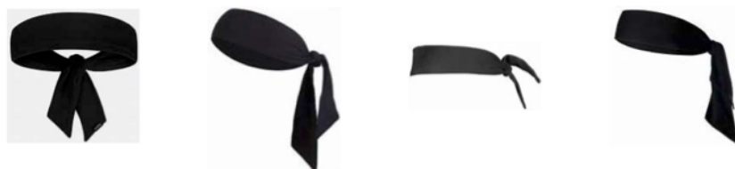
圖 1: 頭巾式頭帶範例