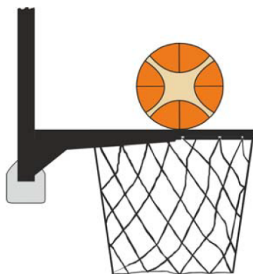
圖 3: 球正與籃圈接觸

31-18 說明：在投籃時，若一防守或進攻球員在球正與籃圈接觸且仍有中籃可能時觸及球籃（籃圈或籃網）或籃板，這是干擾球違例。