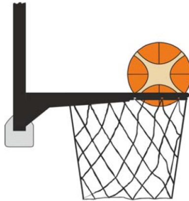
圖 4: 球在球籃中

31-24 範例：A1 試投 2 分。當球在籃圈上旋轉且有最小一部分在球籃中或低於籃圈的平面時，