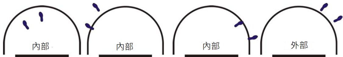
圖 5: 球員的位置：進攻免責區內部/外部

33-4 範例：A1 從進攻免責區外開始跳投。A1 撞上正與進攻免責區接觸的 B1。