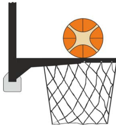
圖 3: 球正與籃圈接觸

31-20 說明：在投籃時，若一防守或進攻球員在球正與籃圈接觸且仍有中籃可能時觸及球籃（籃圈或籃網）或籃板，這是干擾球違例。