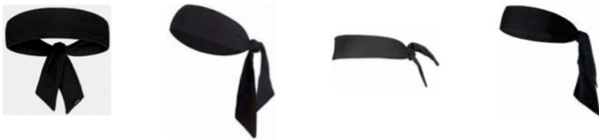
圖 1: 頭巾式頭帶範例